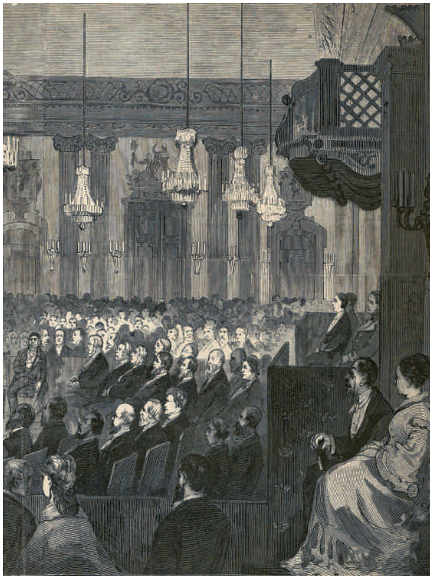
Stora Börsalen i Stockholm den 3 april 1877. Tecknad af G. Larsson.