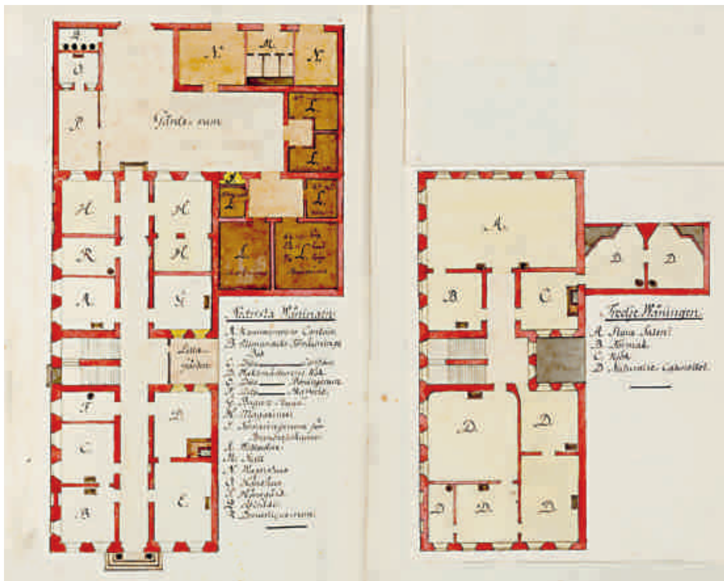
RITNINGAR över Vetenskapsakademiens hus på Stora Nygatan efter omflyttningen 1784.

uttalad intention att föra ut kunskaper till allmänheten. I och med detta var också tjänsten som föreståndare formellt inrättad.