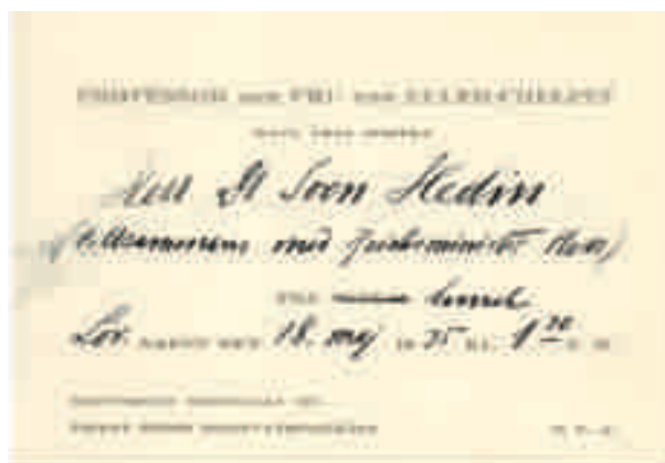
LUNCHINBJUDAN från paret von Euler till Sven Hedin 1935.

Böök, Hedin och von Euler-Chelpin var centralt placerade inom Nobel-systemet. Böök var ledamot av Svenska Akademiens Nobelkommitté; Hedin var medlem av både Svenska Akademien och Vetenskapsakademien; von Euler var själv Nobelpristagare (1929) och hörde till de mest inflytelserika inom Nobelkommittén för kemi. De två senare hade dessutom kontakter i det nazistiska ledarskiktet. Hedin påstods vara Hitlers favoritförfattare och han fick vid ett antal tillfällen audiens hos honom i Berlin. von Euler hade lärt känna Hermann Göring under första världskriget och höll kontakten med honom under nazistperioden, bland annat i egenskap av medlem i den av Göring instiftade akademien för flygforskning. Att von Euler när Rudolf Hess 1935 besökte Stockholm bjöd honom och Hedin på lunch betyder kanske inte att svenskarna hade någon nära kontakt med Hitlers ställföreträdare. Men händelsen illustrerar att de hörde till den grupp ledande representanter för tysk-svensk samverkan som vid behov kunde mobilisera kontakter inom det nationalsocialistiska partiets högsta skikt. Hedin tackade för övrigt nej till en liknande inbjudan från von Euler i samband med inrikesminister Wilhelm Fricks besök i Stockholm i november 1937 – han påstod sig ha fått sammanlagt fem sådana inbjudningar och ansåg att rikministern också borde få se nya ansikten.